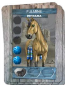
MAZZO DI SCARTO