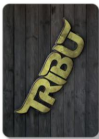
MAZZO DI PESCAGGIO

Le carte Azione, se giocate e non scartate, vanno eliminate fino alla sfida successiva, ponendole in un' altra pila di fianco al mazzo di scarto, creando così il mazzo delle giocate da cui non si può pescare.