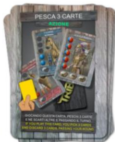
MAZZO DELLE GIOCATE